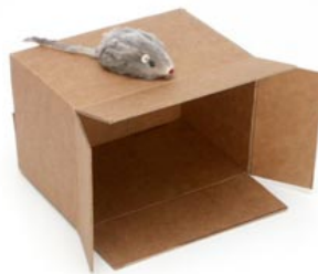
de muis zit op de doos