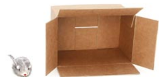
de muis zit naast de doos