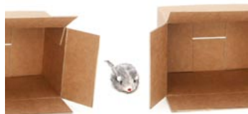
de muis zit tussen de dozen