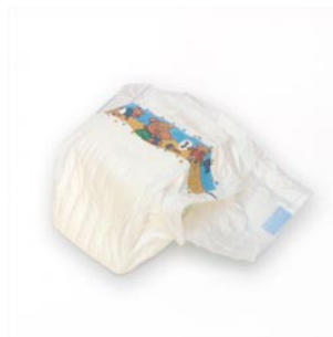
5 de luijer