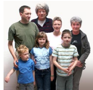
3 de familie