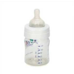
4 de fles