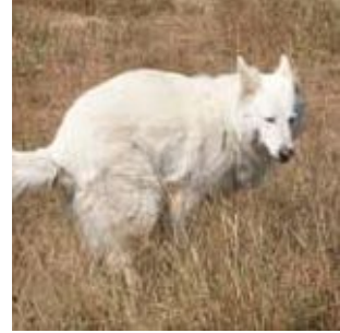
12 de hond