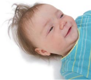
1 de baby