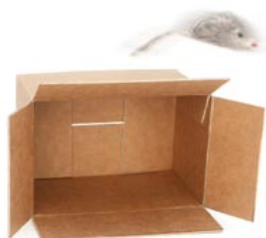
de muis springt over de doos