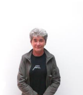
8 de oma