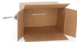
de muis zit achter de doos