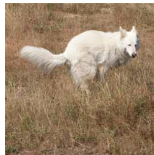
6 De hond poept