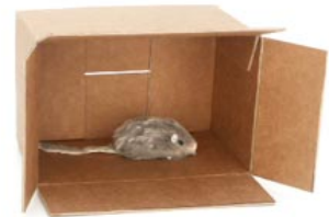
de muis is in de doos