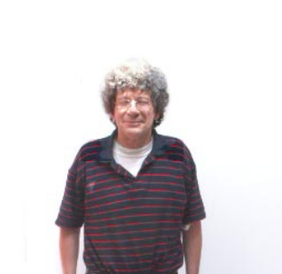
9 de opa