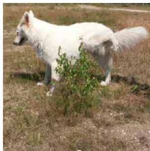
5 De hond plast