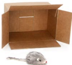
de muis zit voor de doos