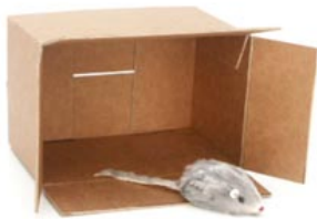
de muis gaat uit de doos