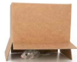
de muis zit onder de doos