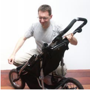
10 de vader