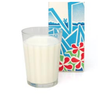
6 de melk