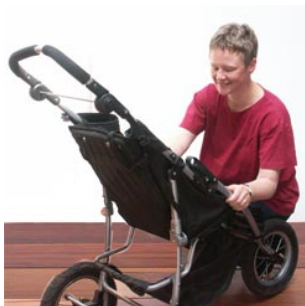
7 de moeder