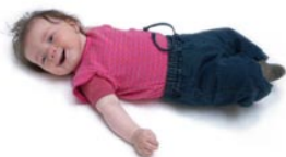
4 De baby lacht