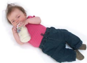
1 De baby drinkt