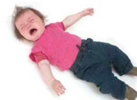
3 De baby huilt