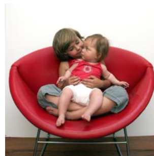
9 Tim vindt